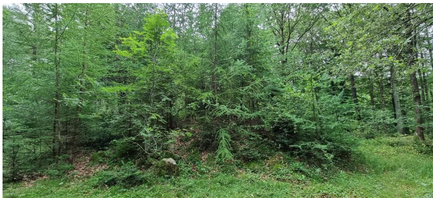
Det første Missionshus lå i det egekrat som kaldes Egelund mellem Dalgas-stenen og hovedvejen. I 1916 blev der lavet en "falsk" gravhøj med nogle markante randsten på stedet. Højen er desværre vokset helt til.