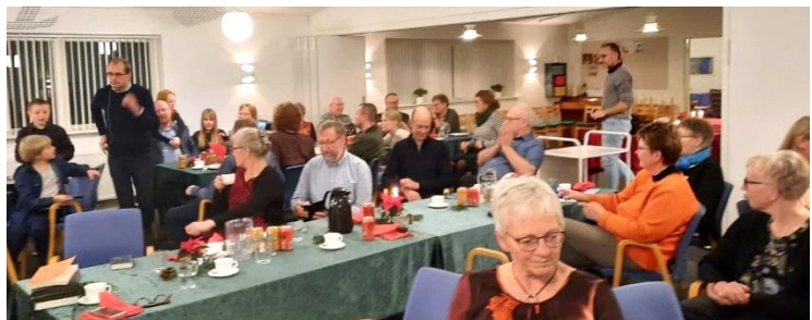
Billede fra adventsfest i missionshuset december 2021

Til de månedlige møder i dag samles typisk 20-30 deltagere. Ligesom i 1720-erne samles folk i dag der, hvor ordet om Jesus Kristus bliver forkyndt trofast og med personlighed og der er også i dag både sang, bøn, kaffe og sociale aktiviteter.